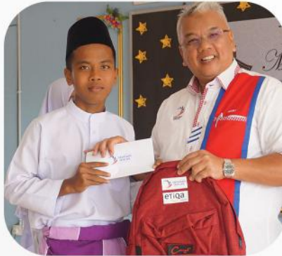
*Parit Buntar, Perak