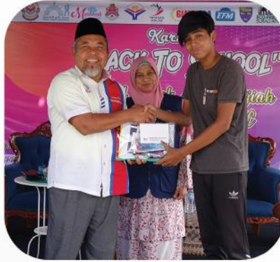
*Pantai Dalam, Kuala Lumpur