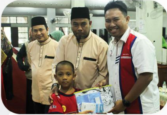
*Bandar Baru Bangi, Selangor